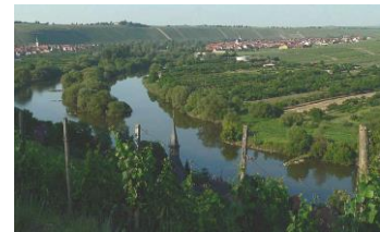
Mainschleife bei Volkach